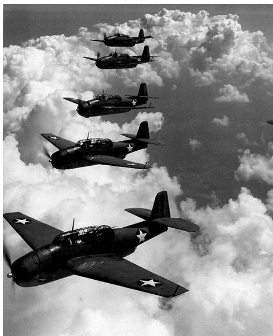
Let číslo 19

http://upload.wikimedia.org/wikipedia/commons/thumb/f/f0/TBF_%28Avengers%29_flying_in_formation.jpg/220px-TBF_%28Avengers%29_flying_in_formation.jpg