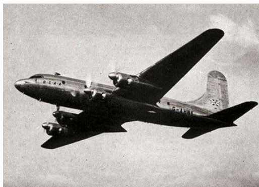
dopravní letadlo Star Tiger

http://img.abicko.cz/img/5/gallery/510577_letadlo-star-tiger-bermudsky-trojuhelnik.jpg