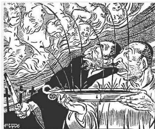
Durch die Jahrtausende vergoß der Jude, geheimem Ritus folgend, Menschenblut. Der Teufel sieht uns heute noch im Nacken, es liegt an Euch die Teufelsbrut zu pochen